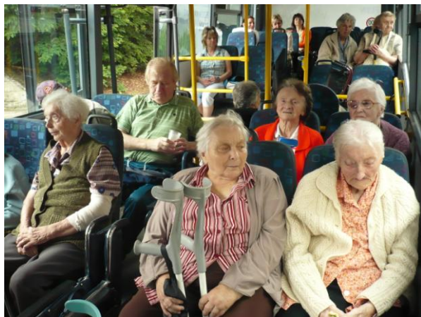
Motovýlet s aktivizačními pracovníci