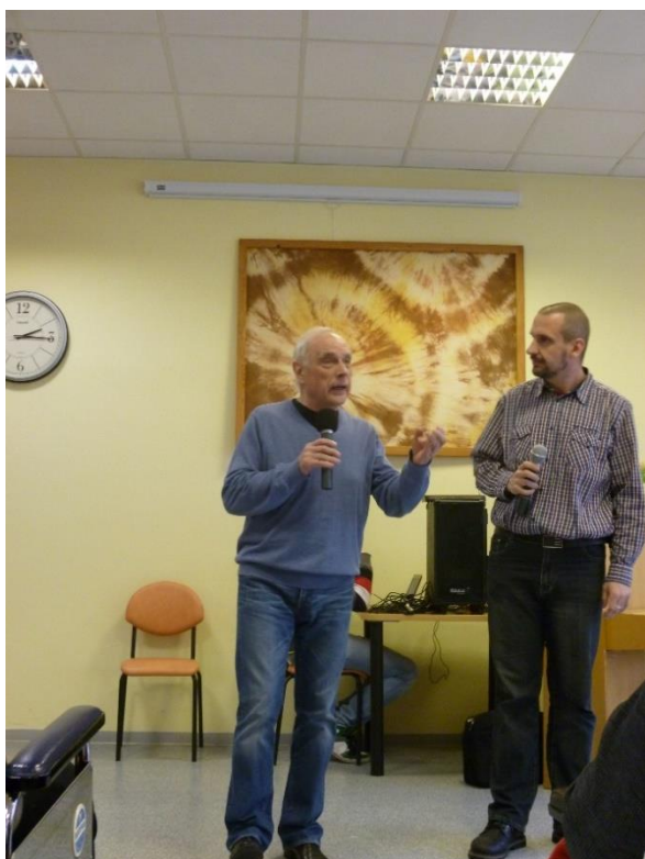
herec Ladislav Županič