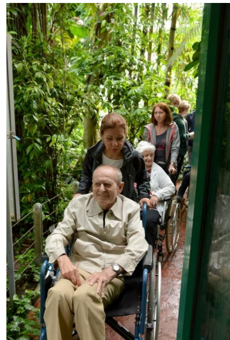
Domov důchodců Pohoda v Botanické zahradě v Liberci