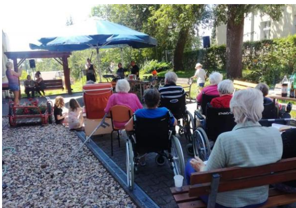
Akce pro seniory a děti z Náruče-hudební doprovod DUO Big Band