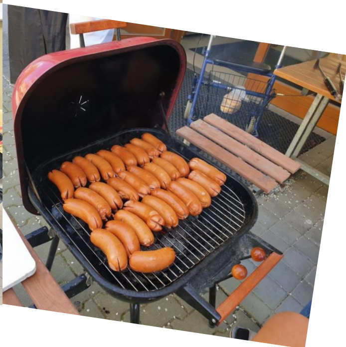
Čarodějnice- tradiční čarodějnice a opékání buřtů