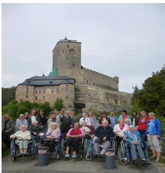
Dobrovolnictví-výlet na hrad Kost