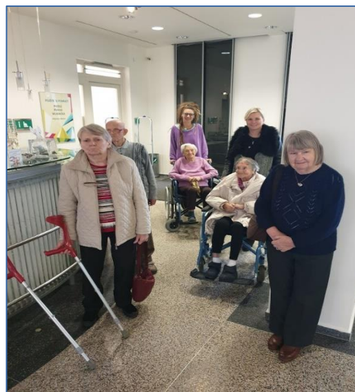
Nadace Preciosa-výlet do muzea bižuterie a skla Jablonec nad Nisou