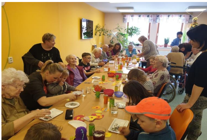
Nadace Preciosa a organizace Náruč-tvoření seniorů a dětí