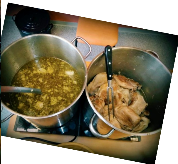
Masopust- první zabíjačkové hody v DD Pohoda